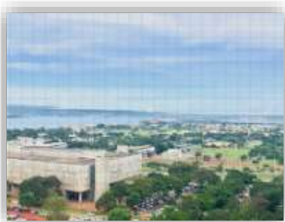
↗ Vista do pavimento (ala norte)