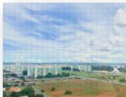
↗ Vista do pavimento (ala sul)